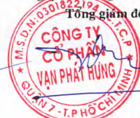
TRƯƠNG THÀNH NHÂN